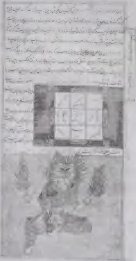
'ನಂಜುಮ್-ಉಲ್-ಉಲುಮ್' ಕೃತಿಯ ಒಂದು ಪುಟ

ಸ್ವತಃ ಚಾಂದ್ ಬೀಬಿ ಚಿತ್ರಬಿಡಿಸುವಲ್ಲಿ ನಿಷ್ಣಾತೆಯಾಗಿದ್ದರೆ, ಅವಳ ಪತಿ ಅಲಿ ಆದಿಲ್ ಶಹನು, ಅಲಂಕಾರಿಕ ಲಿಪಿಯಲ್ಲಿ ತಜ್ಞನಾಗಿದ್ದ. ಅವರ ಪ್ರೋತ್ಸಾಹದಿಂದ ಬಿಜಾಪುರದಲ್ಲಿ ಅನೇಕ ಪ್ರಸಿದ್ಧ ಕಲಾಕಾರರು ಕಾಣಿಸಿಕೊಂಡರು. ಸುದೈವದಿಂದ ಅವರ ಕಾಲದ ಚಿತ್ರಗಳ ಕೆಲ ಪ್ರತಿಗಳು ವಿದೇಶಿ ಮತ್ತು ದೇಶದ ಸಂಗ್ರಹಾಲಯಗಳಲ್ಲಿ ಉಳಿದುಕೊಂಡಿವೆ. ನಕ್ಷತ್ರ ಶಾಸ್ತ್ರಕ್ಕೆ ಸಂಬಂಧಿಸಿದ 'ನಂಜುಮ್-ಉಲ್-ಉಲುಮ್' ಎಂಬ ಸಚಿತ್ರ ಗ್ರಂಥವನ್ನು ಅಲಿಯು ಬರೆಸಿದ. ನಕ್ಷತ್ರದ ನಕ್ಷೆಗಳು, ಮಂತ್ರ ಮಂಡಳಗಳು, ಆಯುಧಗಳು, ಪ್ರಾಣಿಗಳು, ಆನೆಯುದ್ಧ ಮುಂತಾದವು ಅದರಲ್ಲಿ ಇವೆ. ಇದೇ